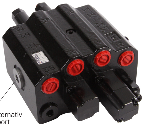
T1 Alternativ tankport

Vid installation av hydraulventiler, använd endast tätningsbrickor som tätning, inte gängtejp, lin eller liknande. Förvissa Er om ifall ventilpaketet skall LS-kopplas, konstantryckskopplas, seriekopplas eller bara ha en ren retur till tank. Förväxla inte dessa installationssätt. Om tryckbegränsare finns skall denna justeras till rätt tryck.