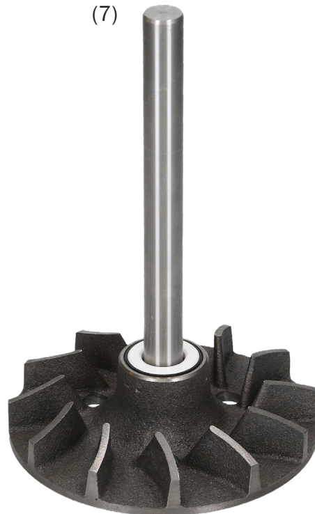
Axel med impeller