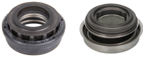
Olika varianter av kolringar